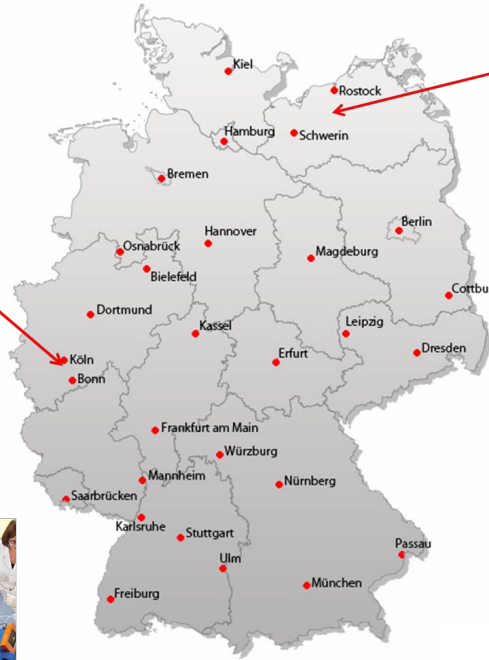
GMP manufacturing facility in Teterow