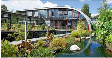
Headquarter in Bergisch Gladbach