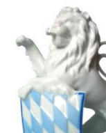
Bayerns Best 50 Preisträger