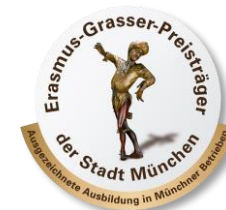
Erasmus-Grasser- Preis der Stadt München