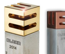
ELMAR Markenpreis der Elektrobranche