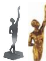
Großer Preis des Mittelstandes